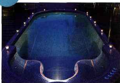
Le spa de nage est conçu pour vous

offrir un bien-être total. Son parcours de massages est diversifié afin de répondre à toutes les attentes : massages toniques, relaxants, activités de détente, gym aquatique... Afin de stimuler tous vos sens, ce modèle est également équipé d'un système innovant de chromothérapie et d'aromathérapie.