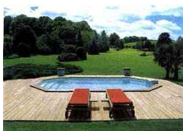
▲ Cette piscine à la plage réalisée tout en bois s'accorde parfaitement dans le paysage. Piscinelle, RG 8.

► Ligne classique pour une composition à l'esthétique irréprochable. Aquilius Piscines, Bora.