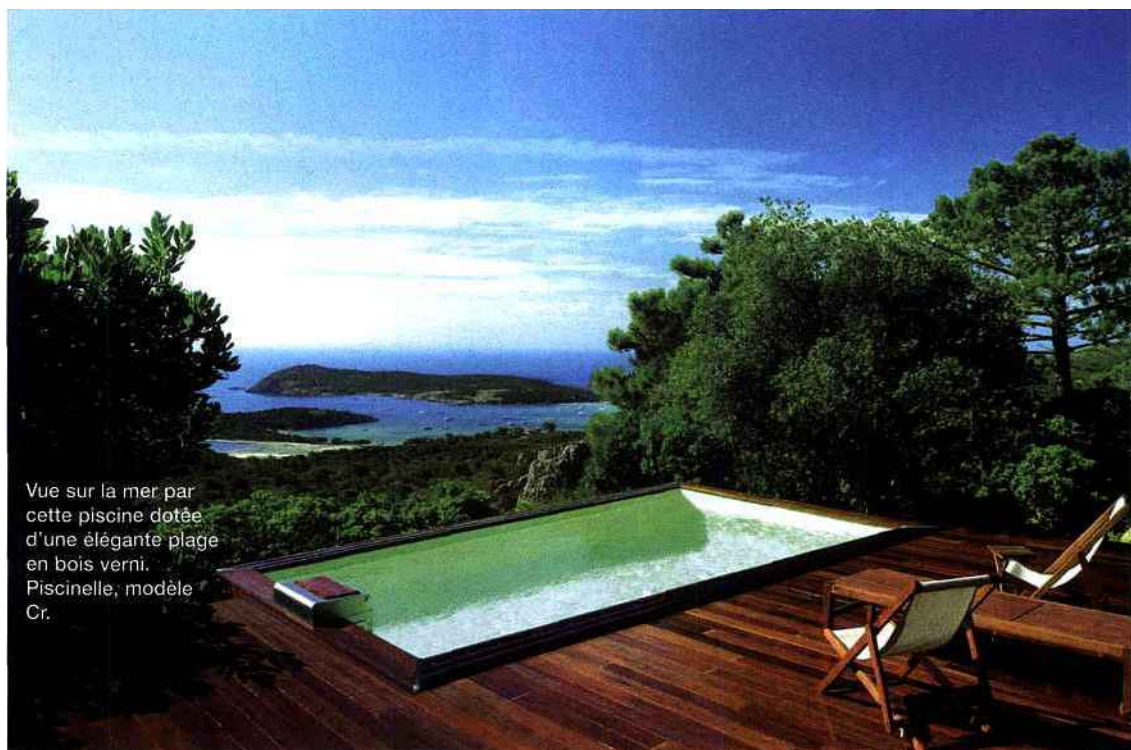
Vue sur la mer par cette piscine dotée d'une élégante plage en bois verni. Piscinelle, modèle Cr.

► Ligne classique pour une composition à l'esthétique irréprochable. Aquilius Piscines, Bora.