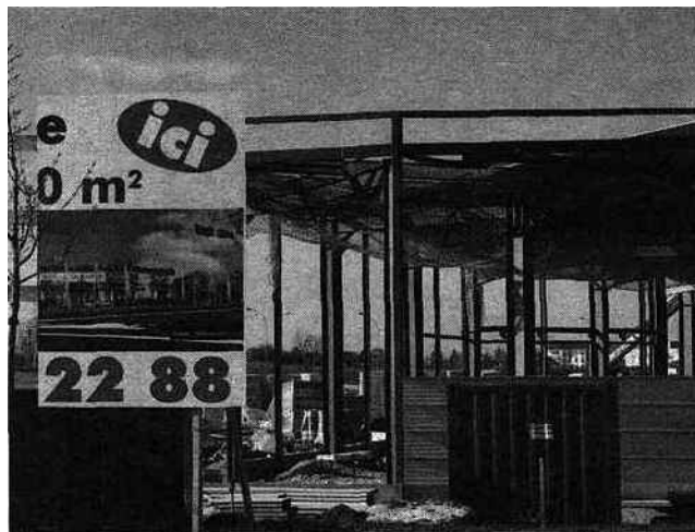
Le bâtiment de 10 000 mètres carrés, en cours de construction, devrait être livré courant mai

Le dossier présenté par le leader français sur le marché du sport prévoit l'implantation d'un magasin de 2 000 mètres carrés, conçu comme un relais avec ses sites de Dijon et Besançon. Deux précédentes autorisations, obtenues en octobre 2006 puis en mars 2008, avaient fait l'objet de recours en justice. « Il a à nouveau été adopté à l'unanimité par les 12 membres de la commission, qui était élargie aux départements limitrophes », précise Phi-